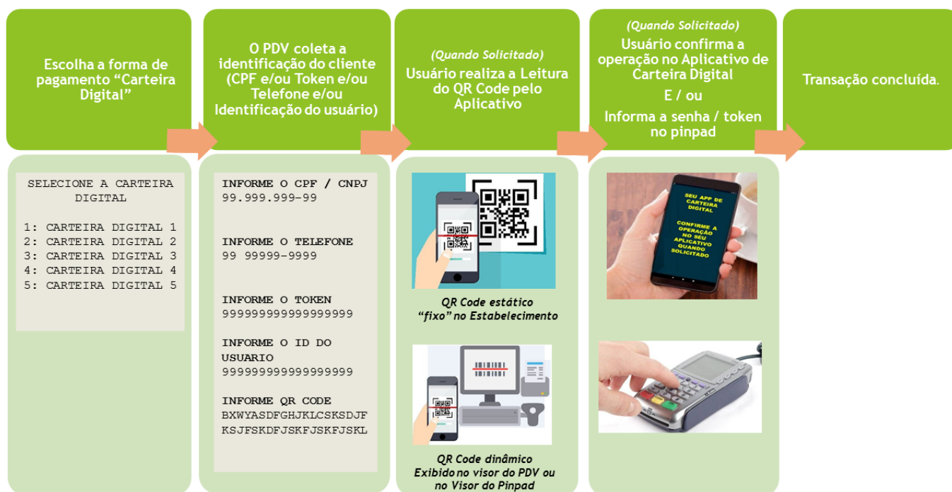
Figura 1 - Fluxo básico de uma transação com Carteira Digital

Em geral, o fluxo de uma transação com Carteira Digital é bem simples, podendo variar de acordo com cada Carteira Digital.